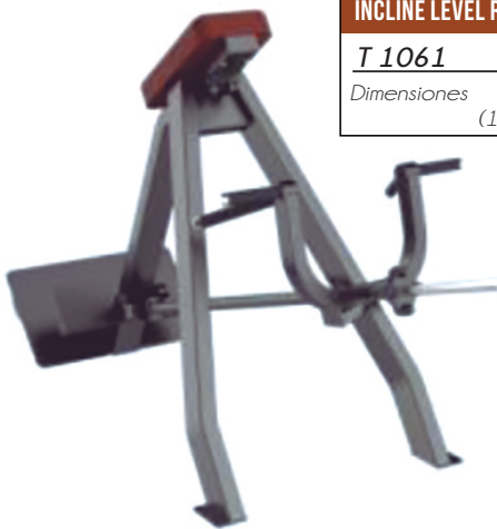
INCLINE LEVEL ROW T 1061 Dimensiones Largo x Ancho x Alto (1.85 x 0.79 x 1.19) mts