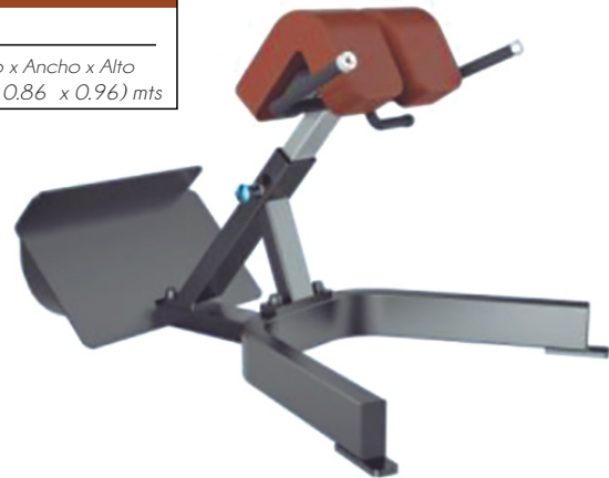
BACK EXTENSION T 1045 Dimensiones Largo x Ancho x Alto (1.22 x 0.86 x 0.96) mts