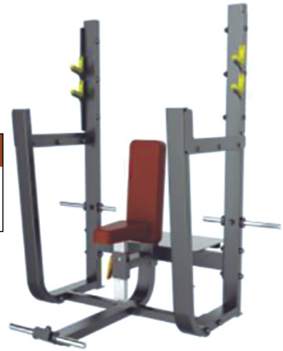
OLYMPIC SEATED BENCH T 1051 Dimensiones Largo x Ancho x Alto (1.55 x 1.78 x 1.80) mts