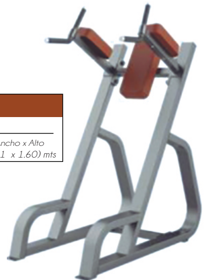
VERTICAL KNESS UP / DIP T 1047 Dimensiones Largo x Ancho x Alto (1.27 x 0.71 x 1.60) mts