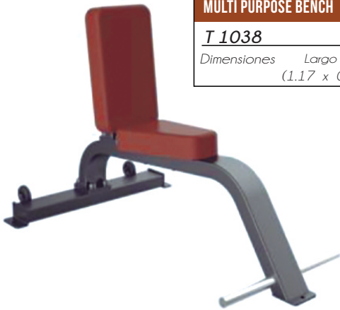
MULTI PURPOSE BENCH T 1038 Dimensiones Largo x Ancho x Alto (1.17 x 0.76 x 0.82) mts