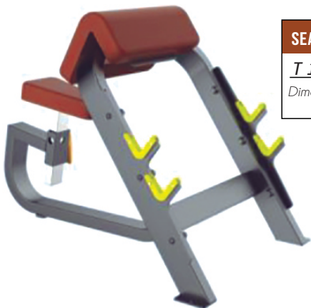
SEATED PREACHER CURL T 1044 Dimensiones Largo x Ancho x Alto (1.32 x 0.84 x 0.97) mts