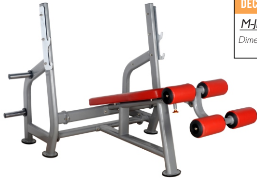
DECLINE PRESS BENCH M-JL 7326 Dimensiones Largo x Ancho x Alto (1.25 x 0.65 x 0.75) mts