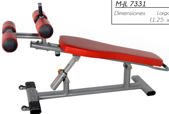
ADJUSTABLE WAB BOARD (ABDOMINAL) M-JL 7331 Dimensiones Largo x Ancho x Alto (1.25 x 0.65 x 0.75) mts