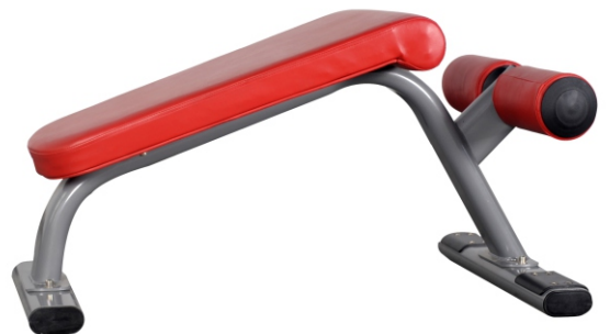
WAB BOARD (ABDOMINAL) M-JL 7332 Dimensiones Largo x Ancho x Alto (1.25 x 0.65 x 0.75) mts

*TODAS LAS MÁQUINAS Tubo redondo de 3MM de espesor.