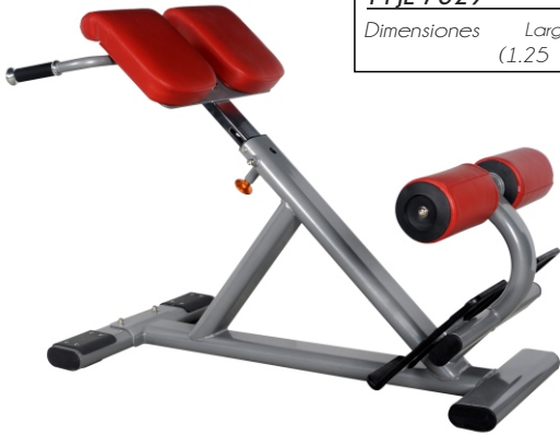
HYPEREXTENSION M-JL 7329 Dimensiones Largo x Ancho x Alto (1.25 x 0.65 x 0.75) mts