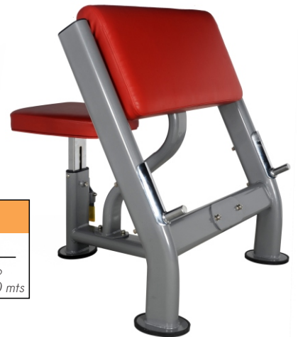
ARM CURL (BICEPS) M-JL 7330 Dimensiones Largo x Ancho x Alto (1.25 x 0.65 x 0.75) mts